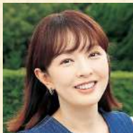
フリーキャスター 丸岡 いずみ氏